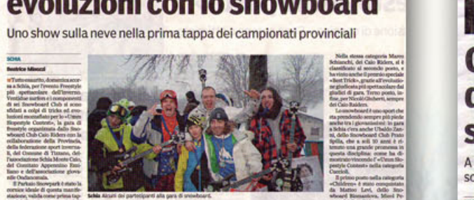
Schia. Alcuni dei partecipanti alla gara di snowboard.

Uno show sulla neve nella prima tappa dei campionati provinciali