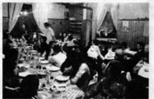
Un momento della cena sociale a Schia

Neve protagonista a gennaio: sull'Appennino vanno in scena le evoluzioni dei patiti della "tavola", in Trentino le traiettorie dei giovani campioni cussini