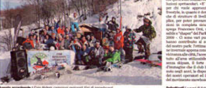
Amato accoglie i Caio Riders campioni regionali FiJi di snowboard