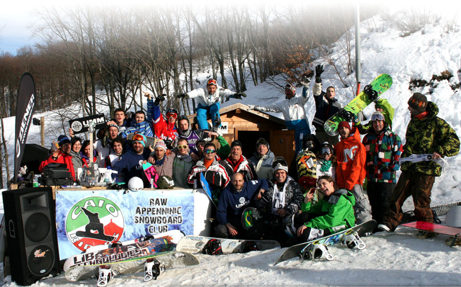
NELLA FOTO: GRUPPO DI RIDERS PARTECIPANTI ALLA GARA SLOPESTYLE, SCHIA, FEBBRAIO 2010